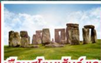
เยือนสโตนเฮ็นจ์ และ พิพิธภัณฑ์โรมันบาส