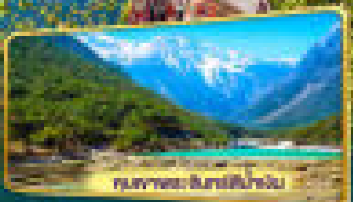
สวนชา Suni Acheu