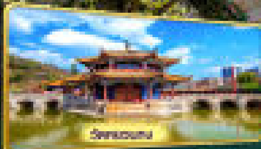
วัดสุพรรณ