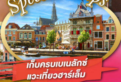
เก็บครบเบเนลักซ์ และเที่ยวฮาร์เล็ม