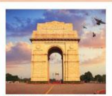
♥♦♦ India Gate