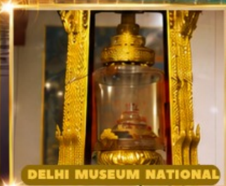
DELHI MUSEUM NATIONAL ถรามนมีศการพระบรมสารีริกธาตุ

เมืองซิมลาในม่านหมอก ดินแดนผู้ดีอังกฤษครึ่งปกครองเมือง / สัมผัสศรัทธาชาวซิกข์ วิหารทองคำกลางสระน้ำอมฤตสาร ชมความงามของ "อาณาจักรดาไลลามะ" ของเหล่ากัเบตที่วัดแห่งชัยชนะ "Namgyal Dratsang"