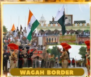
WAGAH BORDER อินเดีย-ปากีสถาน-ด่านวากาห์

เดินทาง 17-22 ต.ค. 69 11-16 พ.ย. 69 05-10 ธ.ค. 69 หยุดวันพ้อแห่งชาติ 31 ธ.ค.69-05 ม.ค. 70 หยุดวันนี้ใหม่