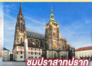
ชมปราสาทปราก