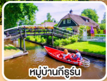
หมู่บ้านกังธูร์น