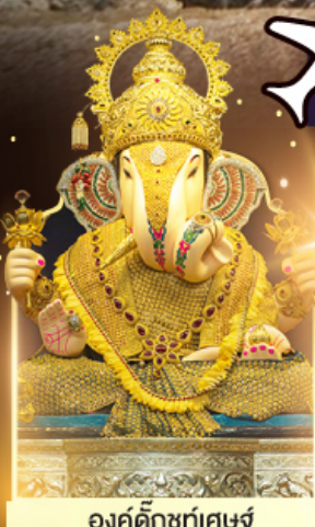
องค์ดีกษุทีพิเศษ

ถ้ำมรดกโลก เที่ยวได้ตลอดปี 25-30 ก.ค. 69 21-26 ต.ค. 69 หยุดวันปิยะมหาราช 18-23 พ.ย. 69 07-12 ธ.ค. 69 หยุดวันพ่อแห่งชาติ 19-24 ม.ค. 70 04 ก.พ.-09 ก.พ. 70