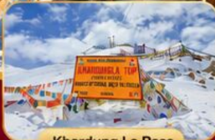
Khardung La Pass