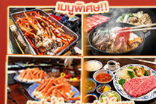
บุฟเฟ่ต์ปู 2 มื้อ + สเต็ก Kobe