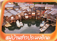
หมู่บ้านชาวประมงอิกะ