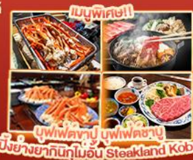
บุฟเฟ่ต์ญี่ปุ่น บุฟเฟ่ต์ญี่ปุ่น สเต็กคินโงะ สเต็กคินโงะ บิงโชบายกินูโมอิน Steakland Kobe