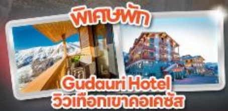
Gudauri Hotel วิวเทือกเขาคอเคซัส

Tbilisi Gudauri Borjomi Kazbegi Uplistsikhe