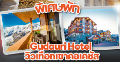
พัศพัศ Gudauri Hotel วิวเทือกเขาคอเคซัส