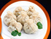
เกี้ยวจอร์เจีย Khinkali