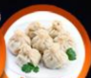
เกี้ยวจอร์เจีย Khinkali