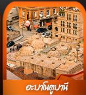
อะบานอทูมานี