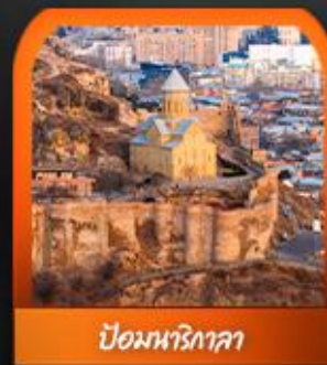
ป้อมนารีทาลา