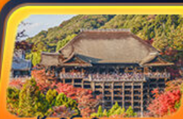
วัดคิโยมิสุตระะ