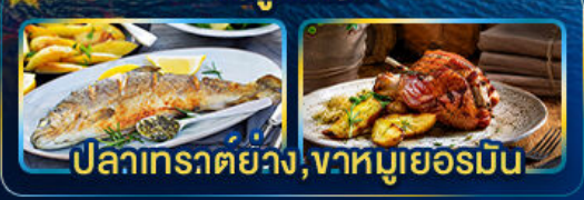
ปลาเทรตยวง, ฆาหมูเยอรมัน

Season Germany Austria Czech of romance.. Slovenia Hungary