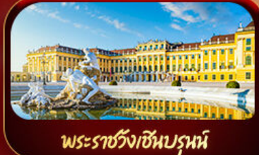
พระราชวังเซินบรูน์