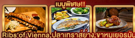
Ribs of Vienna, ปาแตรสาย่าง, จาหมูเยอรมัน

ตะลุยพีชิตยอดเขาซูกสปิตซ์ "Top of Germany" เยือนเมืองมิวนิก จัตุรัสมาเรียนพลัทซ์ สัมผัสเมืองมรดกโลก เซสท์ กรุงลอฟ เยี่ยมชมปราสาทปราก ย้อนรอยอดีตซาลซ์บูร์ก สวนมิราเบล บ้านเกิดของโมซาร์ท ปราสาทบราติสลาวา มหาวิทยาลัยชาร์นบวร์ค สุดโรแมนติกล่องเรือชมความงามแม่น้ำดานูบ จัตุรัสวีนิซุส พระราชวังฮอฟบวร์ก ตื่นตากับความน่าหลงใหลของ หมู่บ้านริมทะเลสาบฮัลล์สตัดท์ พระราชวังเซินบรูน์ ปักกายฮิปโปบิงจู่ใจ