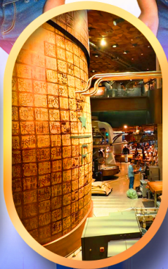
ร้านสตาร์บัคส์