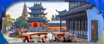
Zhujiajiao Ancient Town ล่องเรือเมืองโบราณ

เซี่ยงไฮ้ ดิสนีย์แลนด์ เมืองโบราณจูเจียเจียว