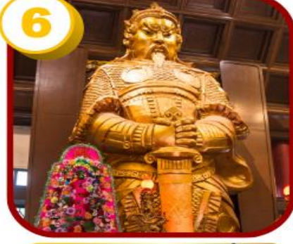
วัดแซกง (ซ่าถิ้น)