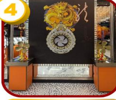
ศูนย์ฮวงจู้กั๊กหัน