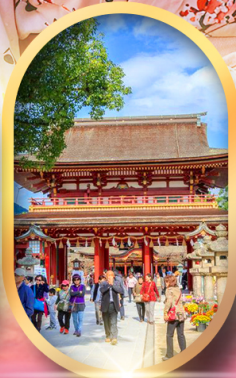
ศาลเจ้าดาโซฟุ