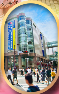
ช้อปปิ้งย่านเท็นจิน