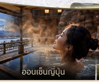
ออนเซ็นญี่ปุ่น