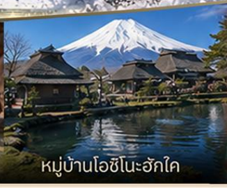
หมู่บ้านโอชิโนะฮักโค