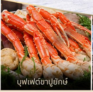
บุฟเฟต์ซาปูยักซ์