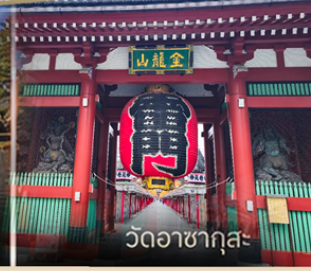
วัดอาสาซุกุสะ