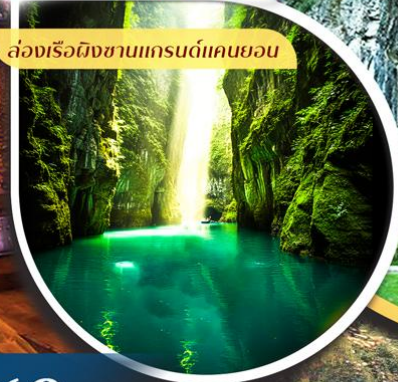
ล่องเรือผิงซานแกรนด์แคนยอน