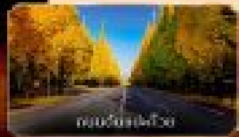
ถนนคาวาโกเอะ

🏠 อาหารเช้า 2 ครั้ง | 🛏️ ที่พักแบบ 2 คน | 🚗 รถส่วนตัว 1 คัน | 🍷 ภัตตาคาร 20 คน | 🏨 โรงแรมคาวาโกเอะ 2 คืน