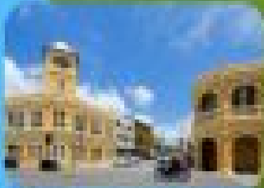
ภูเก็ต ซิตี้วิว

พร้อมชมทัศนียภาพในสวนกอล์ฟที่กว้างขวางโดย มีสิ่งอำนวยความสะดวกครบครันทั้งที่พักและ สนามกอล์ฟที่ทันสมัยพร้อมสนามเทนนิสและ บริการรถรับส่งสนามบินฟรี พร้อมบริการรถรับส่งจากโรงแรมถึง สนามกอล์ฟในวันสุดท้ายของการพักผ่อน