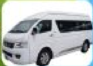
รถรับส่ง