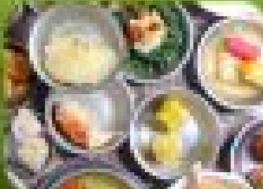
อาหารเช้า ฟินเมือง