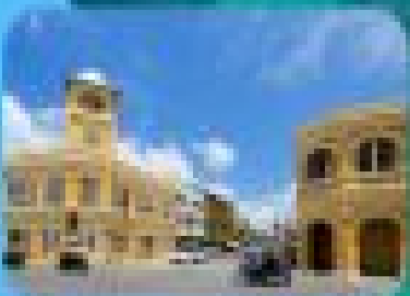
ภูเก็ตเมืองเก่า