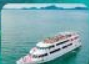
เกาะพีพีทัวร์