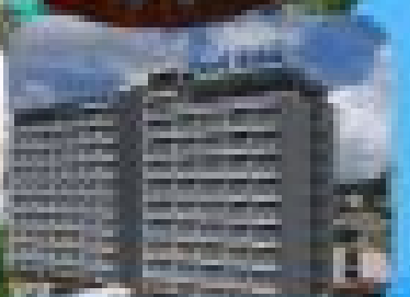
โรงแรมพีพี