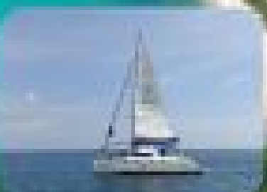
ล่องเรือชั้นเซ็กชั้นเซ็ก