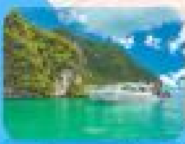
เรือคายัค