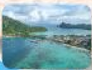
เกาะพีพี