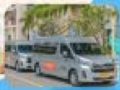
รถรับส่ง