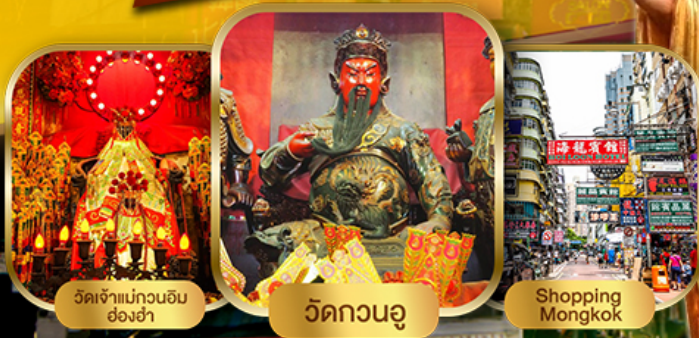
วัดเจ้าแม่กวนอิม ช่องฮ่า วัดกวนอู Shopping Mongkok