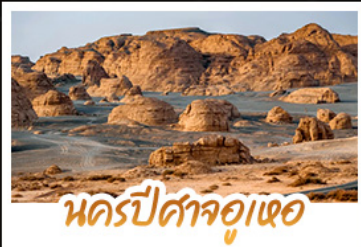
นครปีศาจจู่เหอ

16 - 23 ต.ค. 69 51,900 28 พ.ย. - 05 ธ.ค. 69 50,900 23 - 30 ต.ค. 69 51,900 03 - 10 ธ.ค. 69 51,900 14 - 21 พ.ย. 69 49,900 26 ธ.ค. 69 - 02 ม.ค. 70 57,900