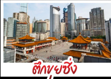
ตึกขุยซิง