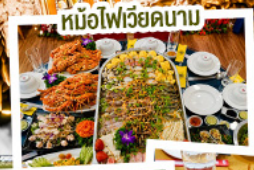
หม้อไฟเวียดนาม