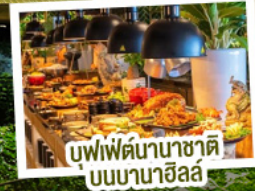
บุฟเฟ่ต์นานาชาติ บนบานาฮิลล์