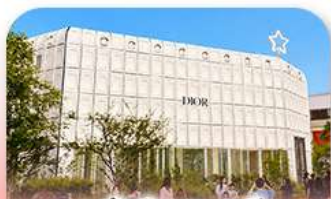
บรูกลินเกาหลี่