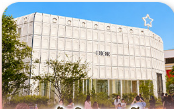
บรักลิเนกาห์ลี