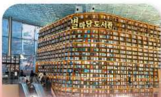
ห้องสมุดสตาร์ฟลา

เก็บทุกไฮไลท์ ในกรุงโซล ตั้งแต่ความงดงามของ พระราชวังเคียงบ็อก ชมวิวสุดอลังการที่ ตึกลิออตเต้ โซลสกาย (รวมค่าลิฟต์ขึ้นตึก) สนุกสุดมันส์ที่ สวนสนุกล็อตเต้ เวิร์ล (รวมค่าบัตรเครื่องเล่น) เพลิดเพลินไปกับโลกใต้ทะเล ล็อตเต้ อควาเรียม (รวมค่าบัตรเข้าชม) เช็กอินแลนด์มาร์กสุดฮิตอย่างห้องสมุดสตาร์ฟลา ไทเอกมอลล์ เดินเล่นย่านฮิป บรูกลินเกาหลี่ ชองชูดง และช้อปปิ้งซัมเมอร์เซล สุดฟิน ย่านเมืองดงและชองแด