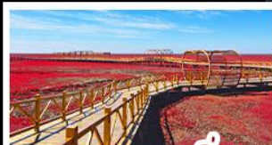
หาดแดงผานจิน