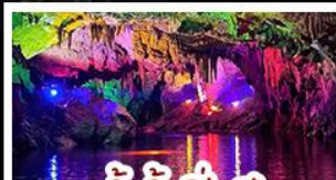
ถ้ำน้ำเป็นสี