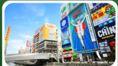
ช้อปปิ้งย่านชินโซบาชิ