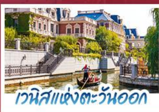
เวนิสแห่งตะวันออก