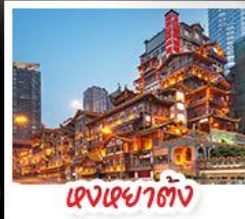
ตงเฉียวตั้ง