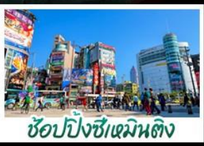
ซ้อปั้งซีเหมินติง