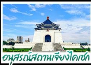
อนุสรณ์สถานเจียงโกดซก

หมู่บ้านปีศาจ - ทะเลสาบสุริยันจันทรา ตึกไทเป 101 - อุทยานแห่งชาติเจียงโคซก หมู่บ้านโบราณจิวเฟิ่น - ซ้อปั้งซีเหมินติง