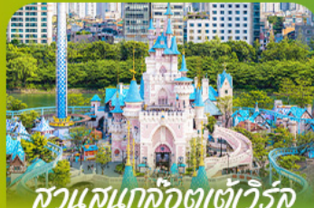
สวนสนุกล๊อตเวิลด์ Lotte Adventure World