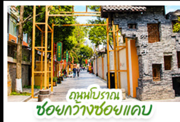
ถนนโบราณ ชอยกวางชอยแคบ