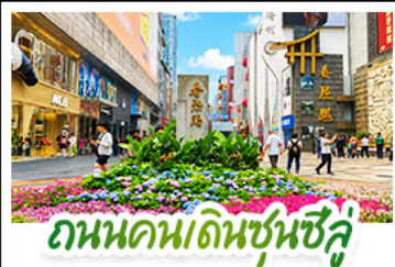
ถนนคนเดินชุนชิลล์