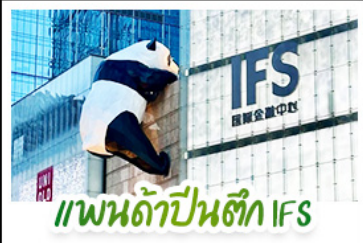
แพนด้าปีนตึก IFS

เดินทาง 11 - 15 ก.ย. 69 04 - 08 ก.ย. 69 | 18 - 22 ก.ย. 69