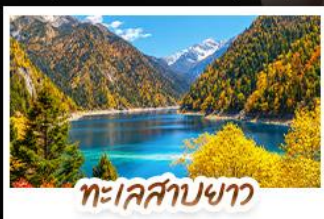
ทะเลสาบขาว