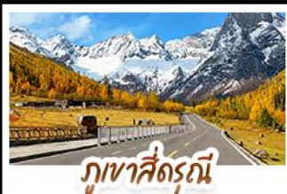
ภูเขาสื่อดรุณี

เที่ยวครบ 3 อุทยานชื่อดังแห่งสแควน ชมวิวยอดเขาหิมะ ณ อุทยานภูเขาสื่อดรุณี (ชื่อภูเขาหมื่นชาน) อุทยานปี้เฝิงโกว เพลิดเพลินกับวิวทะเลสาบ ป่าสน และใบไม้เปลี่ยนสี อุทยานจิวจ้ายโกว มรดกโลกทางธรรมชาติ น้ำใสสีฟ้าราวภาพวาด สัมผัสประสบการณ์นั่งรถไฟความเร็วสูง