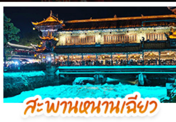
สะพานเทียนเหมินเฉียว