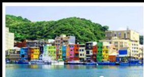
ทำเรือประมงเจ้งปิ่น

รถไฟสายโบราณอาลี้ชาน - ตี้กไท่เป่ 101 ประมงเจ้งปิ่น - จิวเฟิ่น - ล่องเรือทะเลสาบสุริยอันจินกรา งามเบบู่เค็ด เซี่ยวหลงเป่า & ปลายี่ประ-รานาธิบตี ซื้อปิ้ง 3 ย่านดั่ง : ซี้หมิ่นดั่ง - ไถ่จงโม้เก่มารตี้ - MITSUI OUTLET