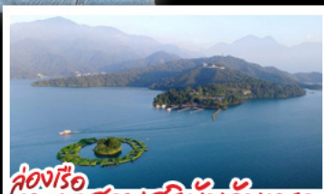
ล่องเรือทะเลสาบสุริยัมจินตรา