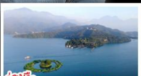
ล่องเรือทะเลสาบสุริยอันจินกรา