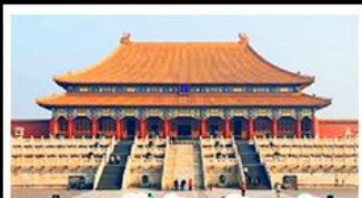
พระราชวังต้องห้าม (ปักกิ่ง)