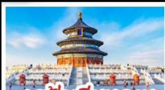
เขื่อนฟ้าเทียนถ่าน