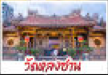
วัดสุหนี่