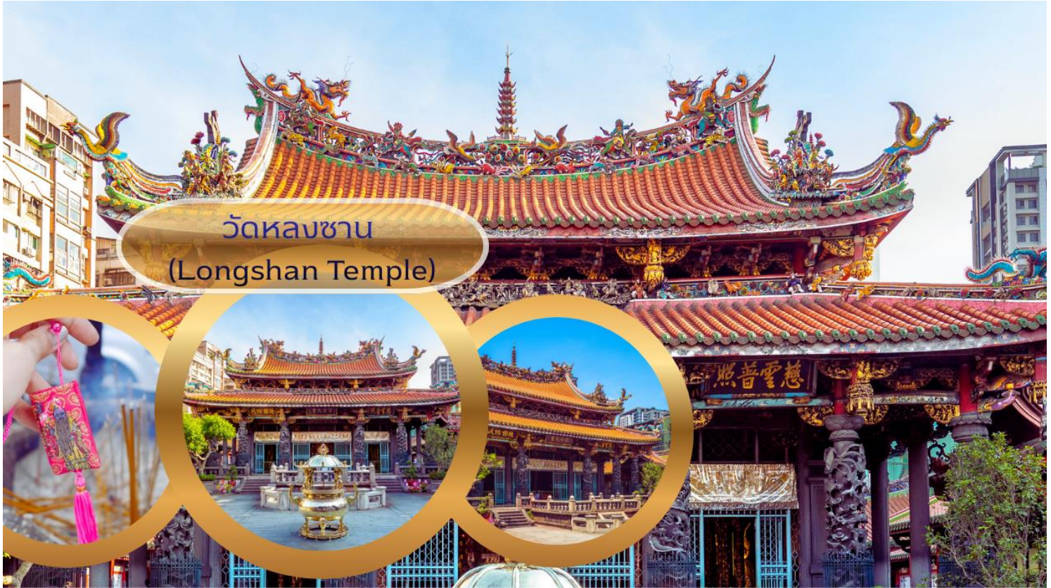
วัดหลงซาน (Longshan Temple)

นิยมมาไหว้ขอพรก็คือ "ผู้เฒ่าจันทรา" เทพเจ้าแห่งตำนานด้ายแดงผู้กุมชะตาบุพเพสันนิวาส โดยเชื่อว่าหากไปขอด้ายแดงกับผู้เฒ่าจันทราก็จะสมหวังในเรื่องความรักและจะได้พบเนื้อคู่