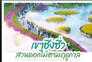
เขาสังซิว สวนดอกไม้ตามฤดูกาล