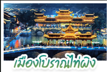
เมืองโบราณโก่ผิง