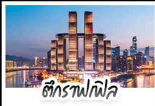
ตึกรูปฝั้ว