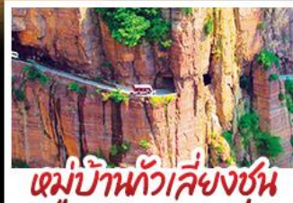
หมู่บ้านทิวสียงซุน