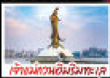
ศาลสมเด็จพระนเรศวรมหาราช