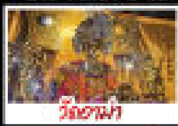
วิวยามค่ำคืน

CHIMELONG SPACESHIP PARK CHIMELONG OCEAN KINGDOM ผู้ให้บริการคือ โรงแรมเชลลียง รีสอร์ทภูเก็ต และสวนสนุกไฮเทคมาทากาโอ กรุณาอ่านเงื่อนไขการจองเพิ่มเติมที่หน้าการจอง