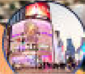
เมืองเซี่ยงไฮ้