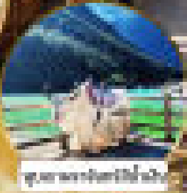
อุทยานแห่งชาติลี่เจียง