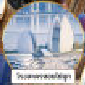
เรือสำราญยักษ์