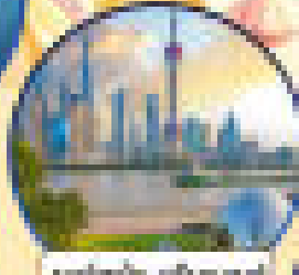
เชียงใหม่