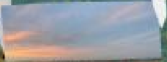
สองริมน้ำโขง