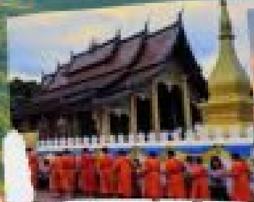
วัดบวรนิเวศวิหาร

กรุณาจองล่วงหน้าก่อนวันออกบิน 30 วัน มีที่นั่งจำกัดจำนวนวันที่ 25/12 - 31/12 ของทุกปี