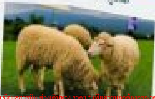
ทุ่งหญ้า