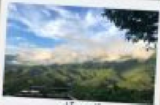
แม่เปิน-เด่น