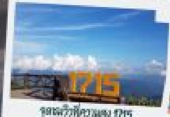
จุดชมวิวผืนดินสูง 1715