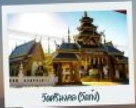
วัดศรีมงคล (สีทอง)