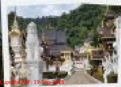
วัดศรีมงคล